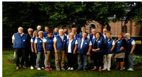
Medlemmar i Nystart Enköping

Så skapar vi ett Enköping som är till för dig och mig. Tillsammans!